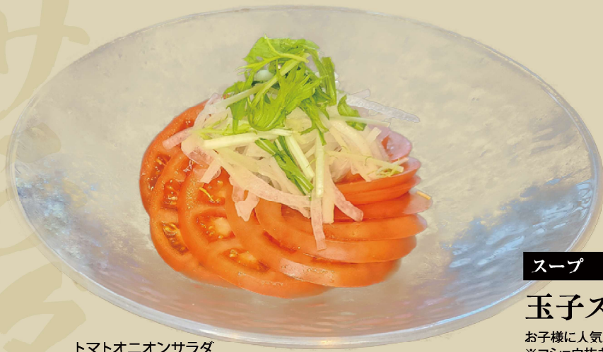
トマトオニオンサラダ