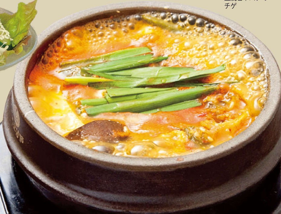
豆腐とキムチのチゲ