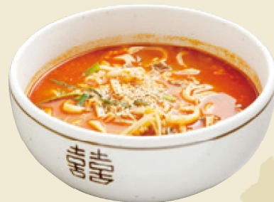
ユッケジャンうどん

ユッケジャンうどん 1,080円 (税込1,188円) ツルツルもちもちの高級麺を使用しております。 1辛・2辛・3辛