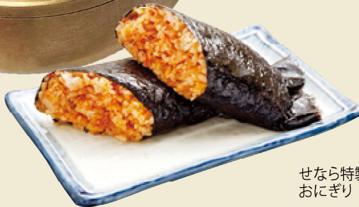
せなら特製おにぎり